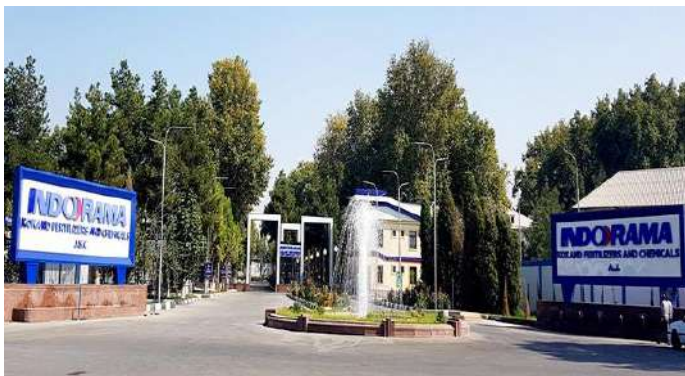
“Indorama Kokand Fertilizers and Chemicals” АЖ га кириш