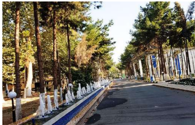
Жамиятнинг атроф мухити