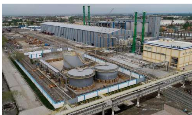
ишлаб чиқариш хуудди