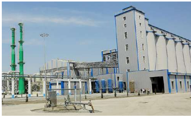
Суперфосфат ишлаб чиқариш цехи